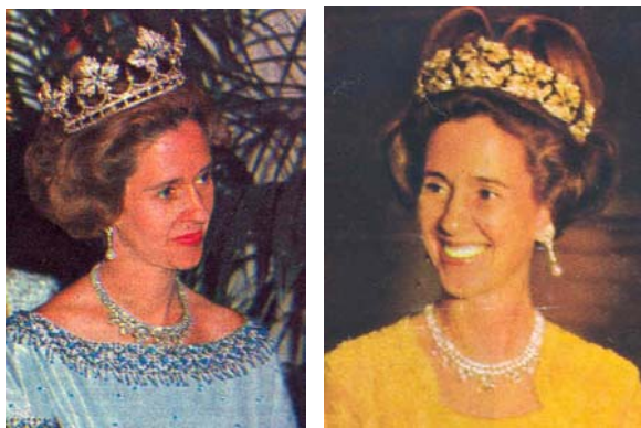
La misma joya usada como corona y como diadema.