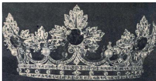
Izquierda: la diadema de Eugenia de Montijo. Derecha: la regalada a Fabiola en 1960.

Vamos a entrar en el estudio comparado de dos joyas excepcionales, las coronas de la Emperatriz Eugenia y de la Reina Fabiola. Para ser más precisos, vamos a estudiar la historia de dos de las coronas que ambas damas poseyeron. Quizás entre los lectores del texto de esta conferencia, algunos se pregunten el por qué de esta extraña unión entre Eugenia de Teba y Fabiola de Mora. Hay varios motivos que justifiquen tal emparejamiento: de una parte, ambas damas son españolas, nacidas en la aristocracia, pero ajenas al círculo de las Familias Reales 1 , y ambas llegaron a sentarse por derecho de cónyuge en dos tronos de Europa. Por otro lado, las joyas de las que nos ocupamos tuvieron un acusado parecido formal, ya que la corona de Eugenia, en su montaje de 1858, seguía un diseño heráldico mezclando elementos de las coronas ducal y marquesal, al igual que ocurría con uno de los montajes que aún en nuestros días puede adoptar la corona de la Reina Fabiola.