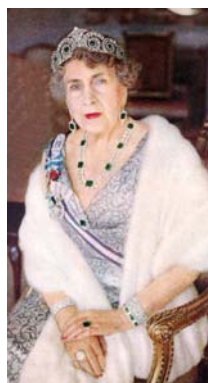
Victoria Eugenia luce todas sus esmeraldas, remontadas por Cartier.

En 1961, con objeto de conseguir liquidez económica para afrontar los gastos que se avecinaban con motivo de la próxima celebración de la boda de su nieto, el Príncipe de Asturias, Don Juan Carlos, con la Princesa Sofía de Grecia, la Reina Viuda de España puso en venta el collar, el anillo y el broche antes descritos. La subasta se encomendó a la sala Jürg Stucker, de Berna, y tuvo lugar los días 14 y 15 de noviembre, reportando a Doña Victoria Eugenia un total de 960.000 francos suizos. La sortija, valorada en 150.000 francos, superó los 200.000, en tanto que el broche se remató en 50.000 francos. El collar, valorado en 1.200.000, centró la puja entre dos compradores, y se adjudicó en tan sólo 560.000. Fue comprado por la Casa Cartier 5 .