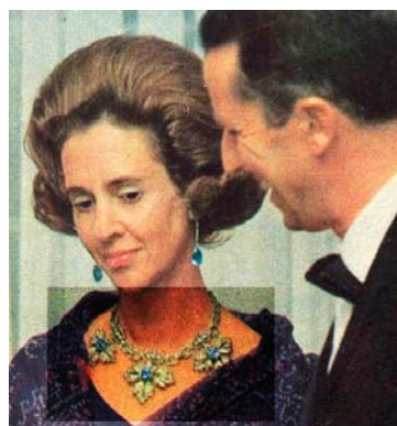
Izq.: la duquesa Ángela de Medinaceli en 1859, por Dubufe. Derecha: durante su visita a Alemania, la Reina Fabiola usó la corona como collar, con las aguamarinas que le regaló el Rey Balduino.

Queda, pues, claro que es falso que esta joya no haya sido usada más que una vez por la Reina Fabiola, pero no es esta la única aportación que podemos hacer al conocimiento de tan curiosa alhaja. También podemos afirmar que la casa de la Grandeza de España que la tuvo en su propiedad antes de la Reina de los belgas fue la casa ducal de Medinaceli, a la cual se la adquirió el Estado español por indicación de Doña Carmen Polo, cuya amistad con tan egregio linaje era conocida en la época del enlace del Rey Balduino. Un retrato que Dubufe pintó de la duquesa Ángela 10 , fechable en torno a la Navidad de 1859 11 , conservado en el Hospital Tavera, de Toledo, nos muestra esta corona, ornada de rubíes.