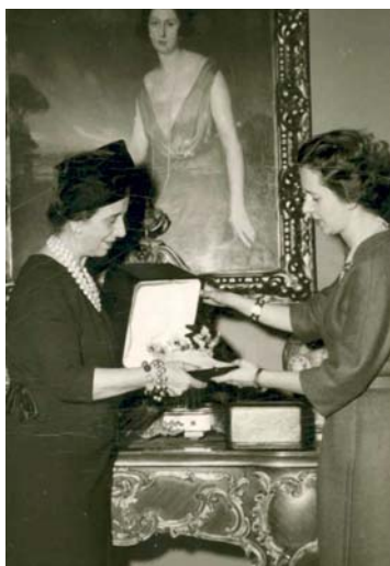
Doña Carmen Polo de Franco hace entrega a Fabiola de Mora de la corona que le regala España con motivo de su boda con el Rey de los belgas.

Este era el regalo que le hacía la nación española, y por ello le fue entregado por la esposa del entonces Jefe del Estado, doña Carmen Polo de Franco, quien se personó al efecto, junto a su hija, la marquesa de Villaverde, en el Palacio de la calle Zurbano y, ante una multitud de periodistas gráficos 9 , entregó la corona en uno de los estuches, posando junto a la futura reina de los belgas, que mostraba su satisfacción por el valioso y bonito obsequio. Sobre el escritorio rococó situado tras las dos damas quedaba un segundo estuche con la montura que permitía lucir la joya como diadema.