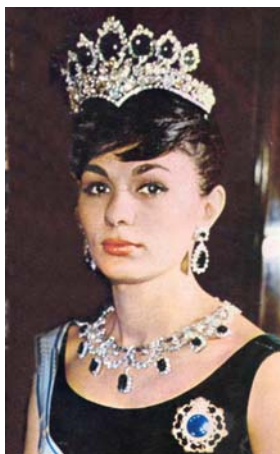
1967, Farah luce el collar con las esmeraldas de Eugenia de Montijo, montadas por Wiston.

Durante años, la soberana iraní se adornó con esta fastuosa joya en muy diferentes ocasiones, generalmente en visitas oficiales al extranjero, como, por citar algunos ejemplos, cuando los monarcas persas fueron recibidos por el matrimonio Kennedy en la Casa Blanca, o cuando rindieron visitas a la República Federal alemana y al reino de Tailandia. Pero debe quedar bien claro que esta joya, como tantas otras, era parte del Tesoro Nacional iraní, y que quedó en Teherán al caer la Monarquía de Reza Shah en 1979, no teniéndose noticia de que haya sido enajenado por las autoridades islámicas de aquella república, rumor, al parecer injustificado, que circuló en Occidente hace unos años.