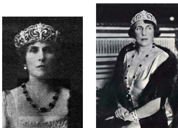
Izquierda: Victoria Eugenia con las esmeraldas montadas por Sanz Derecha: el collar montado por Cartier en 1931, con la cruz de Isabel II.

Ena de Battenberg hizo varias combinaciones con estas piedras. En un primer montaje, efectuado inmediatamente después de recibir las esmeraldas, a principios de la década de los 20, por la joyería madrileña Sanz, se lucían en un collar corto de gusto clásico, engastadas en un marco de roleos rococó de brillantes. Curiosamente, en este collar ya aparecen nueve esmeraldas, dos más de las siete que adornaban la diadema de la Emperatriz Eugenia, y nos consta por el testimonio de los Sanz que una de ellas era falsa, no sabiéndose si todas ellas formaban parte del lote heredado por nuestra Reina o ella misma añadió estas piedras de cualquier otra ignota procedencia.