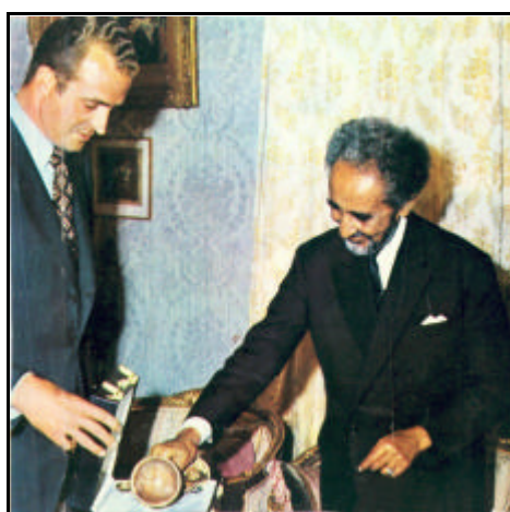
El Príncipe de España entrega al Negus la copia del Grial en 1972