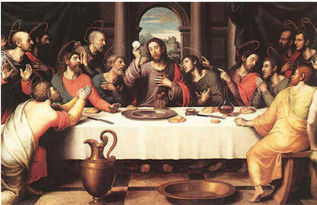
Juan de Juanes, La Última Cena . Museo del Prado, Madrid. Adquirido en 1801 por Carlos IV de la Iglesia de San Esteban, de Valencia. Obsérvese que el artista ha representado el aspecto actual del Santo Grial de Valencia en el cáliz que aparece delante de la figura de Jesucristo, como ocurre en otras muchas pinturas semejantes